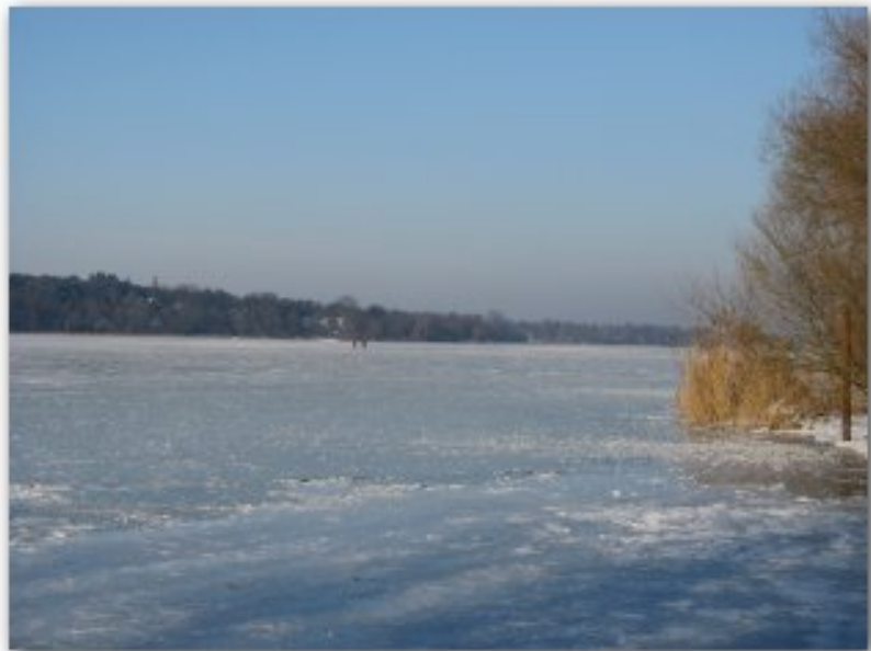
Eis auf der Havel

Toller verbringt nach der Niederschlagung der Münchner Räterepublik - wegen Hochverrats zu fünf Jahren Festungshaft verurteilt - Jahre im Gefängnis, emigriert 1933 über Zürich, Paris, London nach Amerika. Am