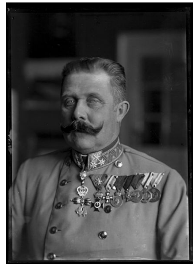
Franz Ferdinand, Erzherzog von Österreich-Este (1863-1914)

Quelle Foto: https://commons.wikimedia.org/wiki/File:Ferdinand_Schmutzer_-_Franz_Ferdinand_von_%C3%96sterreich-Este,_um_1914.jpg Lizenz: CC0 ; Public Domain US